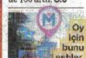
Oy için bunu astılar.

AKP'li Sivas Belediyesi, sosyal tesislerdeki restoranlarda zam yaptı. Bazı ürünlerin fiyatı yüzde 100 arttı. S.5