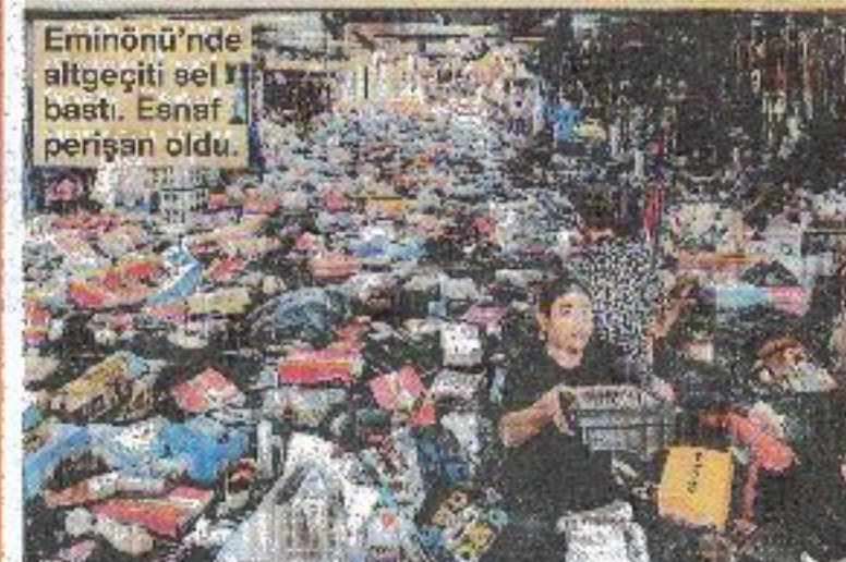
Eminönü'nde alt geçiti sel bastı. Esnaf perişan oldu.

25 yıl AKP zihniyetinin yönettiği İstanbul'da altyapının ihmal edildiği bir kez daha görüldü. Vatandaş, başlıktaki çağırısı yaptı