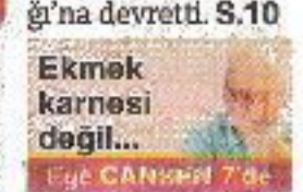
Ekmek karnesi değil...

KOCAELİ Belediyesi tabelalarını astığı projeyi, "Bitiremeyeceğiz" deyip Ulaştırma Bakanlığı'na devretti. S.10