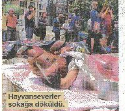
Hayvanseverler sokağa döküldü.

Adalar'da yıllardır tartışma konusu olan ve hayvanseverlerin tepkisini çeken faytonların durumuyla ilgili Başkan İmamoğlu'ndan bir an önce adım atması bekleniyor. İBB geçtiğimiz yıl, atlı faytonların yerine elektrikle çalışan akülü faytonların kullanılacağına açıklamış, ancak bu karar uygulanamamıştı. Faytonlara çözüm bulmak için nasıl bir karar çıkacağı merakla bekleniyor.