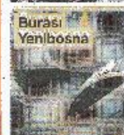
Burası Yeni Bosna

UNKAPANI'nda bir kişi selde öldü. Vatandaş, 1.5 aylık İBB Başkanı İmamoğlu'ndan bir an önce altyapıya el atmasını istedi. S.14