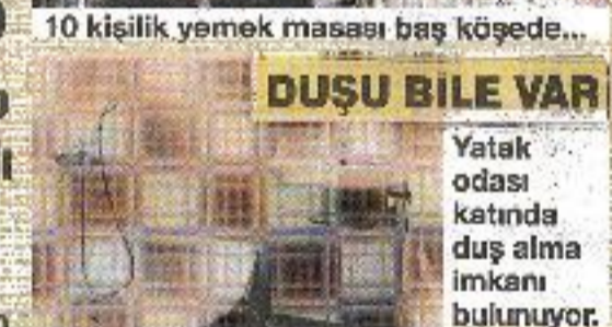
DUŞU BİLE VAR

Yeşil Konak Izmit Belediye Müzesi binası... İçeride, müzeyle alakası olmayan ikiz yatak bulunuyor.